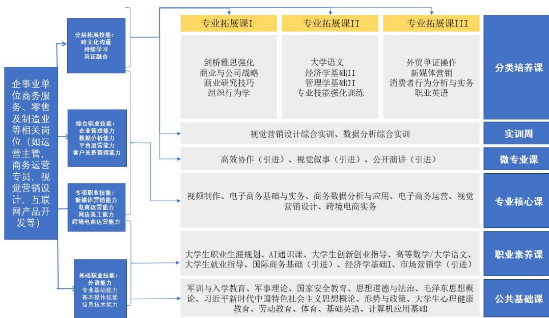
国际经济与贸易技能图谱